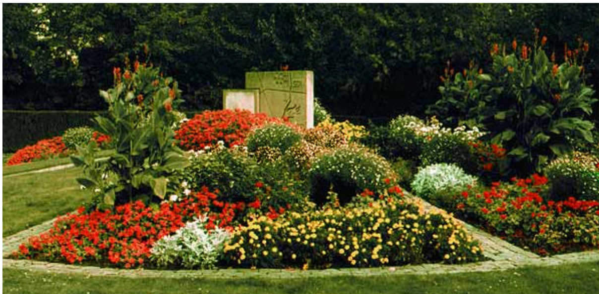
Afb. 13 Het Eindhovense Airborne-monument, ter dankbare herinnering aan onze bevrijders

A. van Beurden, Imperial War Museum, G. Oom, J. v.d. Pas, B. Postema, P. Pulles en J. Starink.