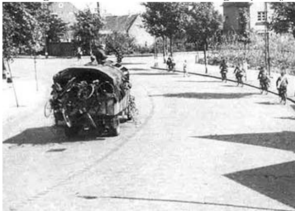
Afb. 6 Op 't Hofke vluchten de Duitsers ... op onze fietsen

Intussen gaat de terugtocht van het Duitse leger onverminderd door. Dag en nacht. Een smadelijke aftocht en een pijnlijke martelgang, vooral voor de oudere soldaten. Zij hebben al hun schamele bezittingen op gammele wagens - waaronder kinderwagens en zelfs brandweervoertuigen - geladen, die met moeite getrokken worden door broodmagere paardjes.