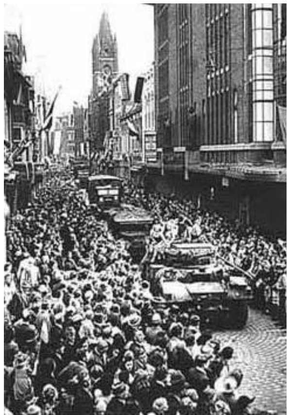
Afb. 9 Glorieuze intocht van het Britse bevrijdingsleger

Het duurt twee dagen voordat de Duitsers bekomen zijn van hun eerste schrik. De spectaculaire landing van duizenden parachutisten heeft hen pijnlijk verrast. Ook de imponerende opmars van het machtige Britse Tweede Leger baart de Duitse legerleiding grote zorgen. Als zij niet snel handelt, dan staat de vijand binnen enkele dagen aan de poort van "Das Vaterland".