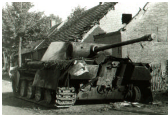
Afb. 12 Zwaar beschadigde Duitse Panther-tanks bij Nuenen

maar ook voor hun stadgenoten en voor Oost-Brabant bleef de vrijheid behouden. De grootste land- en luchtoperatie van deze oorlog, "Market Garden", waaraan drie airborne-divisies en een honderdduizend man sterk landleger deelnamen, bracht de vrijheid terug aan meer dan een miljoen bewoners van Noord-Brabant en Gelderland.