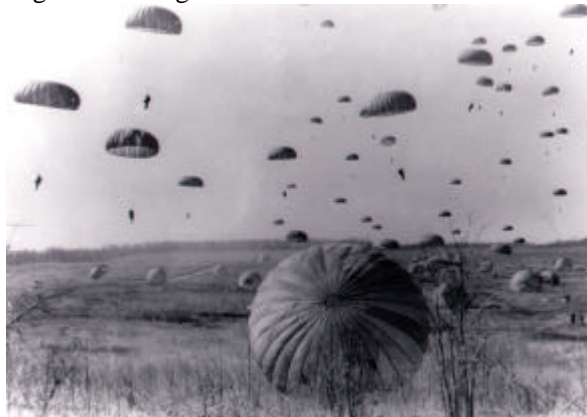
Afb. 8 Onze vrijheid hangt in de lucht

In de morgenuren van 17 september zware bombardementen ten noorden van Eindhoven. Tot verrassing van vriend en vijand landen die zonnige zondag bij Son meer dan vijfduizend Amerikaanse parachutisten. Het snel bevrijde Son ontvangt hen hartelijk. Maar het hoofddoel van de 101e Airborne Divisie voor die dag, Eindhoven, wordt niet bereikt, omdat de Duitsers er in slagen de brug over het Wilhelmina Kanaal in