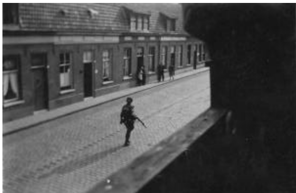
Afb. 7 De eerste Amerikaanse bevrijder op de Tongelresestraat

Amstel om onze gewirre doar veilig te begraven." Zo kreeg die spannende dag een, happy end, het verzet in Tongelre meer wapens en die vindingrijke pastoor een extra kaarsje. Van zijn eigen eerwaarde zusters.