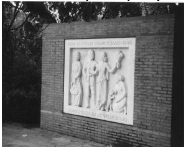
Afb. 5 Het monument voor de vrouw in het Villapark

Deze en andere vrouwen hebben terecht hun eigen verzetsmonument gekregen. Dat staat aan de Zilvermeeuwlaan in het Villapark. Daarop staan bebeeld-